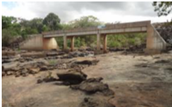
Imagens 4 e 5: Trecho de vazão reduzida da PCH Pedra do Garrafão.

de vazão reduzida (TVR), que ocorre em usinas que operam desviando parte das vazões afluentes para as turbinas (Imagens 4 e 5).