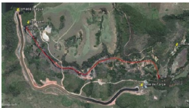
Imagem 6 - Mapa de localização do trecho de vazão reduzida

cente no trecho entre o barramento e a casa de força da PCH Pedra do Garrafão é de 2 \text{ m}^3/\text{s} , valor correspondente a 80% da vazão mínima média mensal observada no histórico de vazões disponível.