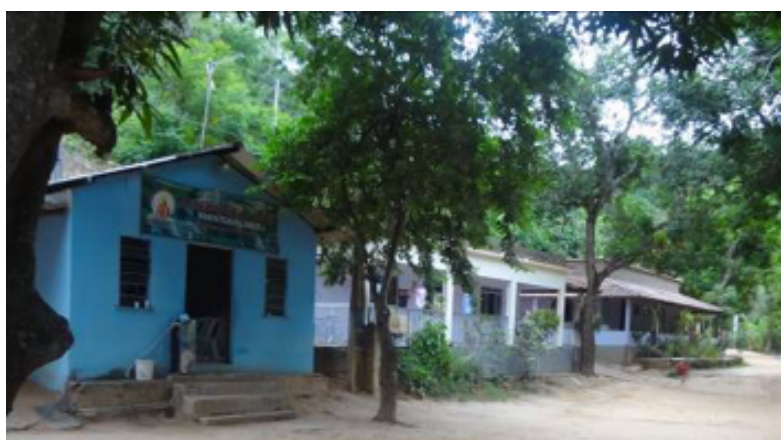
Imagem 3: Comunidade de Limeira

Próxima à PCH, encontra-se a comunidade de Limeira (Imagem 3), que pertence ao Município de Mimoso do Sul/ES e é formada por 13 famílias. Outras 15 famílias fazem parte da colônia de pescadores, mesmo não morando junto ao vilarejo. A comunidade está situada acerca de 2 km a jusante da PCH, dentro da área de influência direta do empreendimento.