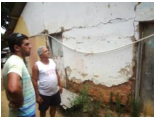
Imagens 11 e 12 - Rachaduras nas casas causadas pela explosão de dinamites

de Pescadores de Limeira - ASPEL, com o intuito de obter maior representatividade. Entretanto, até o momento da última visita realizada, a Associação ainda não tinha sido efetivamente registrada, devido a entraves burocráticos. Com o avanço da construção e desvio do rio para a casa de força, o trecho de vazão reduzida apresentou uma nova realidade para a comunidade: 2 km do Rio Itabapoana se transformaram em um leito rochoso, impossibilitando a sobrevivência de qualquer tipo de vida aquática e, conseqüentemente, impactando a atividade pesqueira. Além disso, também tiveram perdas materiais, pois, segundo relatos, durante a detonação de dinamites na obra, em que era necessário evacuar a área, as casas sofreram rachaduras (Imagens 11 e 12).